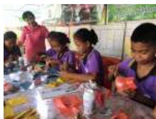
กิจกรรมโครงงานโอ่ง ไหม เงิน ทอง