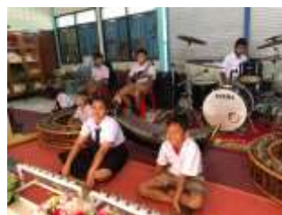
กิจกรรมส่งเสริมด้านดนตรี