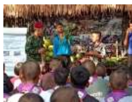
กิจกรรมส่งเสริมด้านพัฒนาผู้เรียน