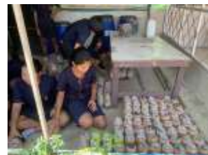
กิจกรรมส่งเสริมด้านงานอาชีพ