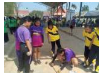
กิจกรรมส่งเสริมด้านกีฬา